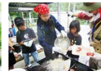
合同バーベキュー