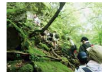
川俣渓谷ハイキング