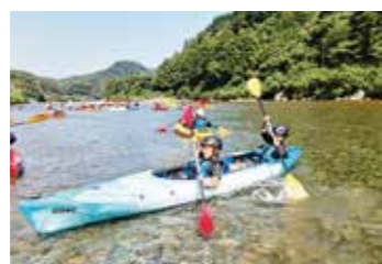
カヌーでの川下り