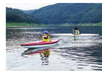
湖でのカヌー体験