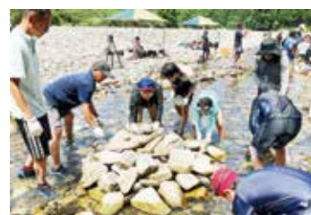
川遊び・うなぎ石漁体験